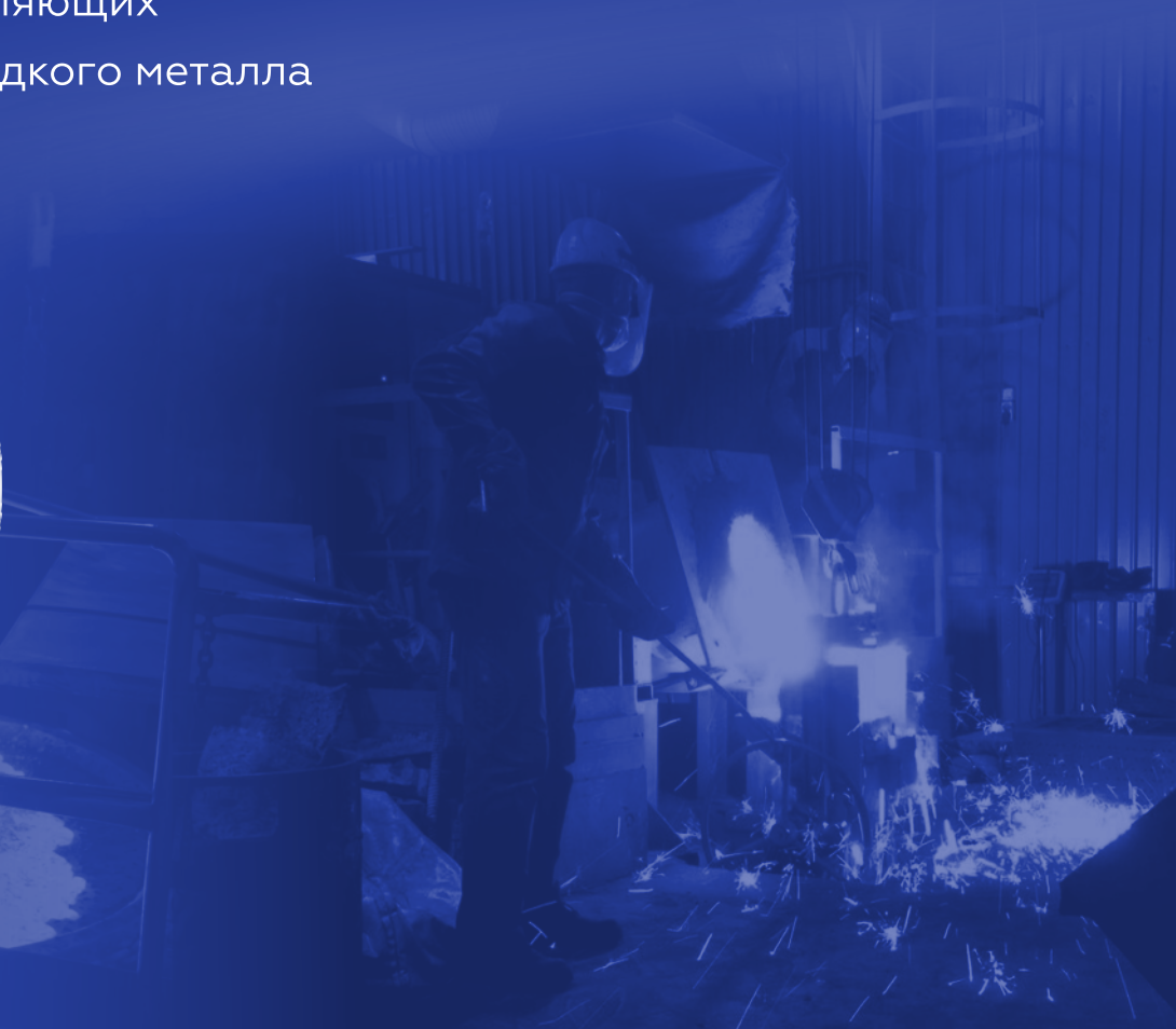
МИКРОКРИСТАЛЛИЧЕСКИЙ МОДИФИКАТОР NPP GROUP